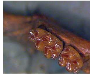
Dents de Mulot sylvestre