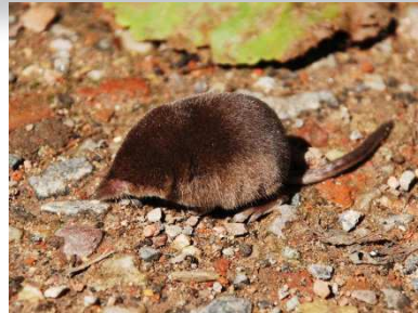
Musaraigne pygmée, Sorex minutus

Rongeur strictement herbivore, vivant dans les sols très profonds et plutôt humides. Il n'est pas considéré comme « nuisible agricole », de ce fait il a été très peu étudié. Son mode de vie souterrain explique pourquoi on le retrouve peu dans les pelotes, ses sorties sont dépendantes de la ressource en nourriture sous terre et du couvert végétal.