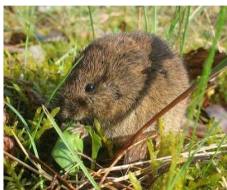
Campagnol des champs, Microtus arvalis

Elles vivent proches de l'Homme, surtout durant l'hiver, car elles sont sensibles aux changements de température.