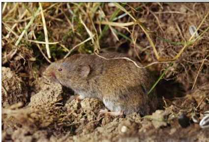
Campagnol souterrain, Microtus subterraneus

Rongeur strictement herbivore, vivant dans les sols très profonds et plutôt humides. Il n'est pas considéré comme « nuisible agricole », de ce fait il a été très peu étudié. Son mode de vie souterrain explique pourquoi on le retrouve peu dans les pelotes, ses sorties sont dépendantes de la ressource en nourriture sous terre et du couvert végétal.