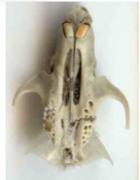
Crâne de Mulot sylvestre