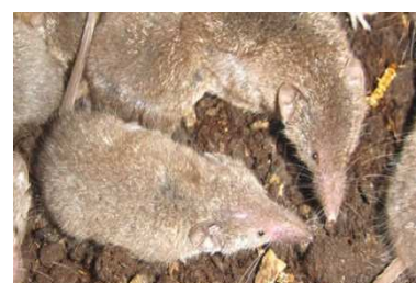
Crocidure musette, Crocidura russula

Le Mulot sylvestre est un rongeur, il se nourrit de graines, plantes et fruits.