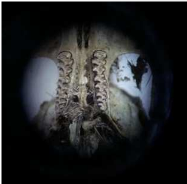
Dents de campagnol des champs, vues au microscope