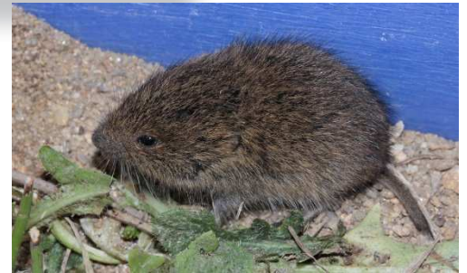
Campagnol de gerbe dit aussi Campagnol des Pyrénées Microtus gerbei

Insectivore des milieux humides, mais également des milieux fermés tels que les boisements ou avec une forte densité herbacée pour se cacher. Sa rareté peut s'expliquer par le fait qu'elle fréquente peu les terrains de chasse de la Chouette effraie (semi-ouverts), ou par la disparition/dégradation de ses habitats.