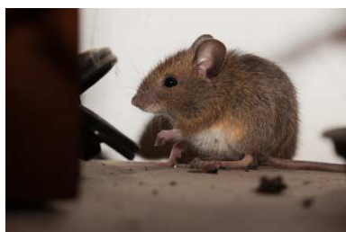
Mulot sylvestre Apodemus sylvaticus

Le Campagnol des champs est un rongeur, il se nourrit de graines, plantes et fruits.