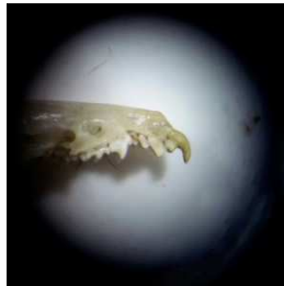
Dents de Crocitude musette