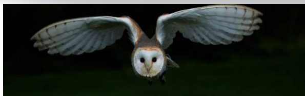
La chouette effraie, Tyto alba

C'est un rapace nocturne, elle se nourrit principalement de micro-mammifères .