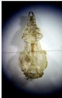
Crâne de Crocitude musette, vu au microscope