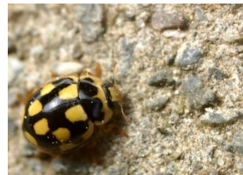
Coccinelle à damier