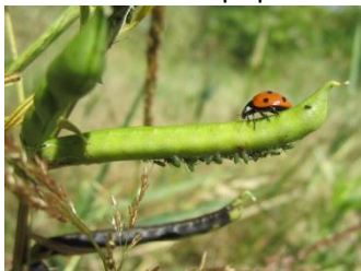
Coccinelle à sept points