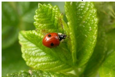
Coccinelle à deux points