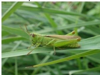
Criquet des roseaux