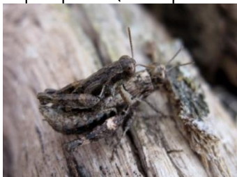
Criquet pansu (accouplement)